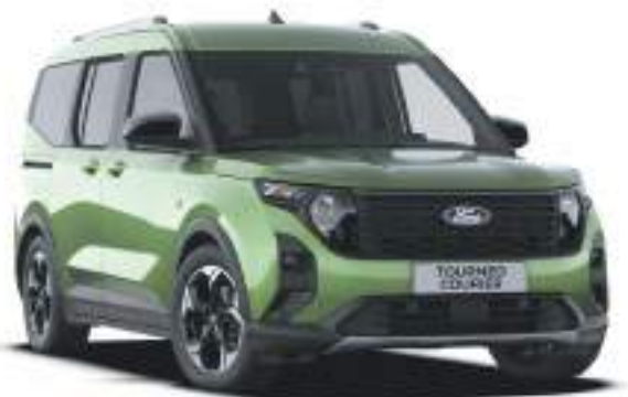
BURSTING GREEN- LAKIER METALIZOWANY