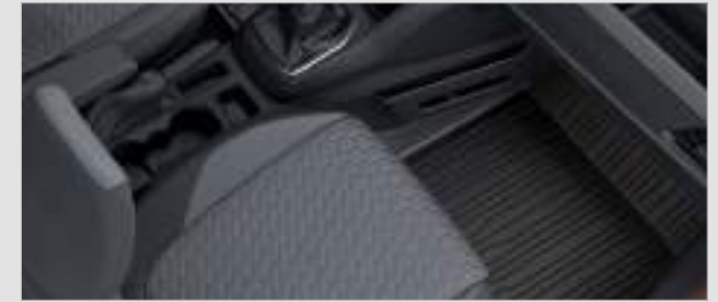
DYWANIKI PODŁOGOWE, GUMOWE CZARNE - PRZEDNIE (2X) 279 zł (2 731 690) - tylko dla wersji z silnikiem benzynowym