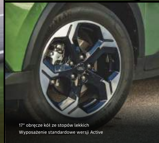
17" obręcze kół ze stopów lekkich Wyposażenie standardowe wersji Active