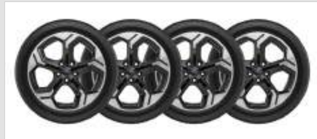
KOMPLET 17" KÓŁ ZIMOWYCH - OPONY SEMPERIT SPEED-GRIP 5, 215/55 6 788 zł (2 773 587)