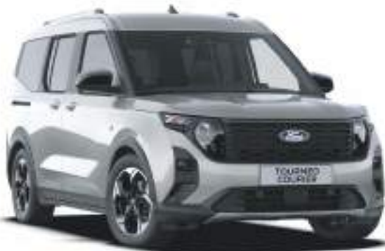
SOLAR SILVER - LAKIER METALIZOWANY 1 722 zł