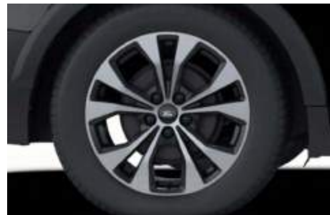
17" OBRĘCZE KÓŁ ZE STOPÓW LEKKICH

Wyposażenie standardowe wersji z napędem elektrycznym