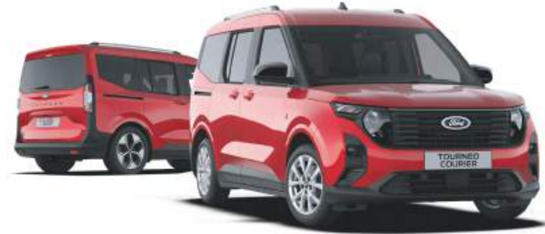
Ford Tourneo Courier w wersji Titanium po lewej stronie - wersja z napędem elektrycznym, po prawej wersja z silnikiem benzynowym kolor nadwozia Fantastic Red (opcja)