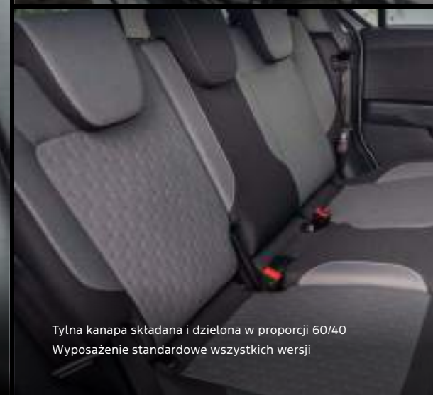
Tylna kanapa składana i dzielona w proporcji 60/40 Wyposażenie standardowe wszystkich wersji