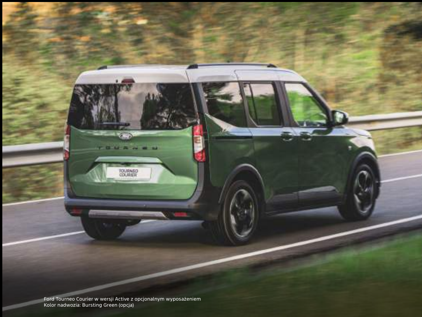
Ford Tourneo Courier w wersji Active z opcjonalnym wyposażeniem Kolor nadwozia: Bursting Green (opcja)