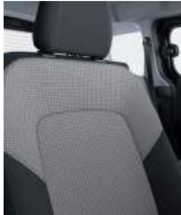
Tapicerka materiałowa (standard)