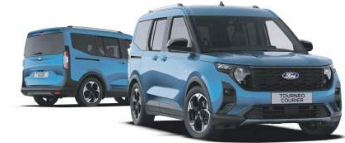
Ford Tourneo Courier w wersji Active po lewej stronie - wersja z napędem elektrycznym, po prawej wersja z silnikiem benzynowym kolor nadwozia Digital Aqua Blue (opcja)