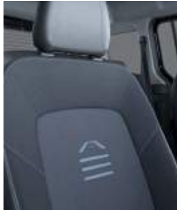
Tapicerka materiałowa (standard)