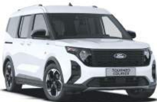
FROZEN WHITE - LAKIER ZWYKŁY bez dopłaty