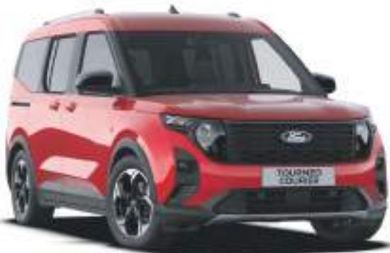
FANTASTIC RED - LAKIER METALIZOWANY 1 722 zł