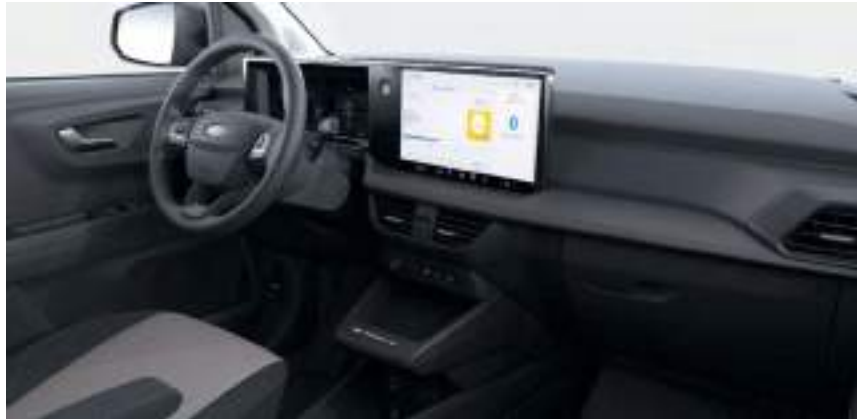
Ford Tourneo Courier w wersji Trend z napędem elektrycznym