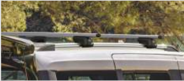
DRAŻKI POPRZECZNE (2X) MOCOWANE DO RELINGÓW 2 030 zł ( 2 792 534)