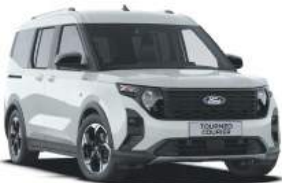
CACTUS GRAY - LAKIER ZWYKŁY bez dopłaty