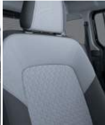
Tapicerka materiałowa (standard)