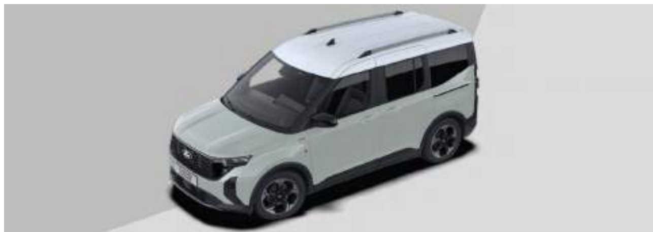
DACH LAKIEROWANY W KOLORZE BIAŁYM

Opcja dostępna tylko dla wersji Active w kolorach: Cactus Grey, Bursting Green