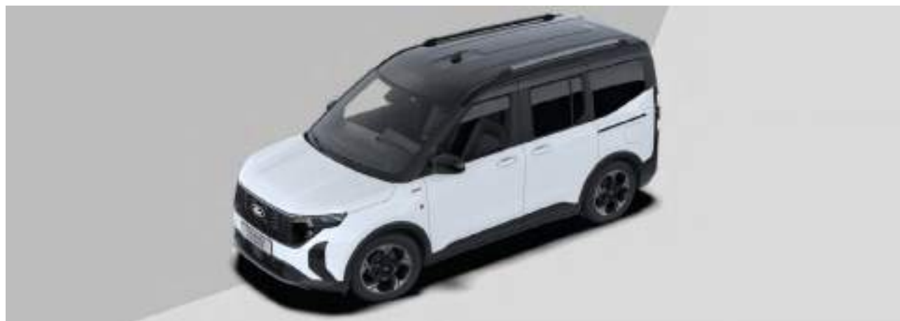
DACH LAKIEROWANY W KOLORZE CZARNYM

Opcja dostępna tylko dla wersji Active w kolorze Frozen White