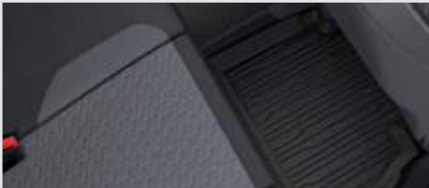
DYWANIKI PODŁOGOWE, GUMOWE CZARNE - TYLNE (2X) 182 zł (2 731 688) - tylko dla wersji z silnikiem benzynowym