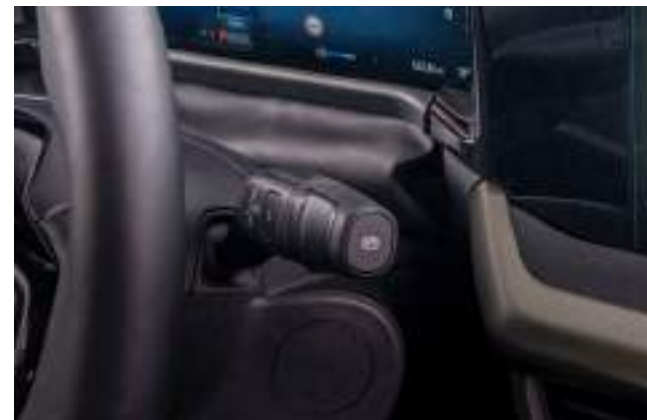
DŹWIGNIA ZMIANY BIEGÓW UMIESZCZONO W MANECIE PRZY KIEROWNICY

Wyposażenie standardowe wersji z napędem elektrycznym