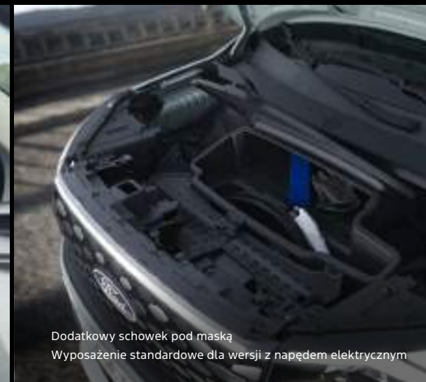
Dodatkowy schowek pod maską Wyposażenie standardowe dla wersji z napędem elektrycznym