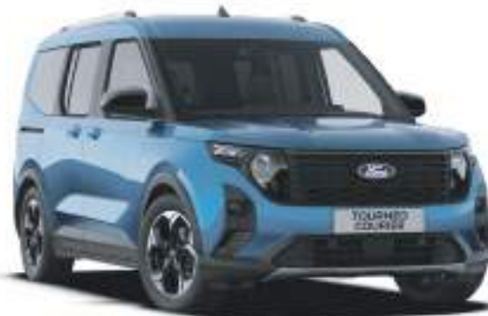
DIGITAL AQUA BLUE - LAKIER METALIZOWANY 1 722 zł