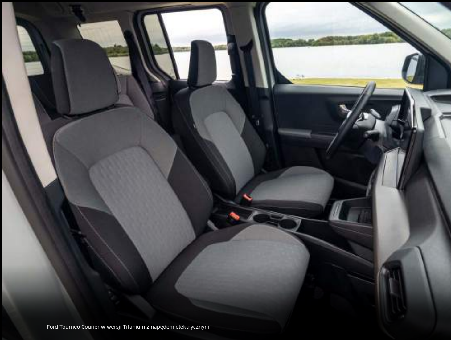
Ford Tourneo Courier w wersji Titanium z napędem elektrycznym