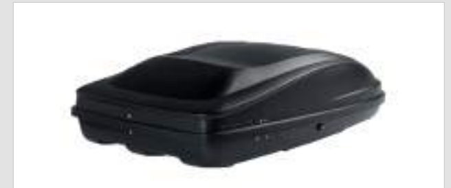
G3 BOX DACHOWY ELEGANCE EUROPE 330 1 378 zł (2 191 625)