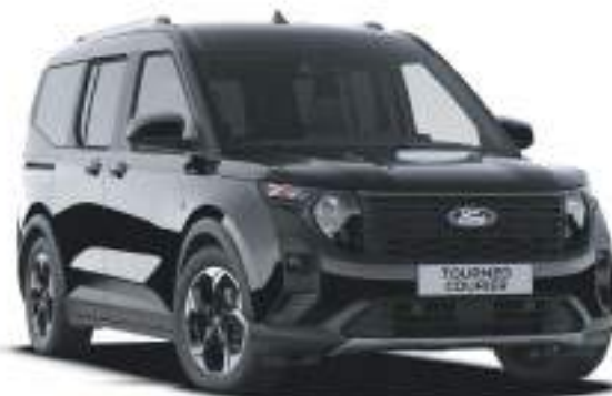
AGATE BLACK- LAKIER METALIZOWANY 1 722 zł