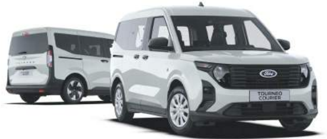
Ford Tourneo Courier w wersji Trend po lewej stronie - wersja z napędem elektrycznym, po prawej wersja z silnikiem benzynowym kolor nadwozia Cactus Grey (bez dopłaty)